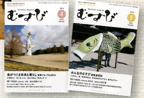
マクロビオティックマガジン 月刊「むすび」