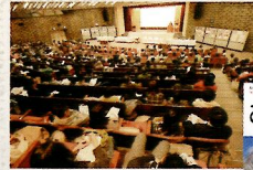
マクロビオティック講演会