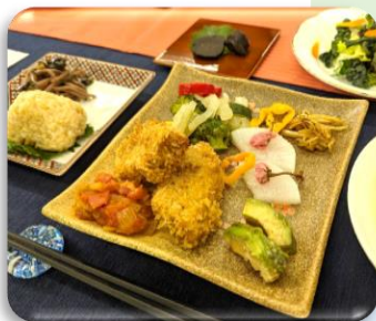
四季に合わせた そらもりランチ▶