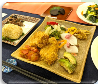
四季に合わせた そらもりランチ▶